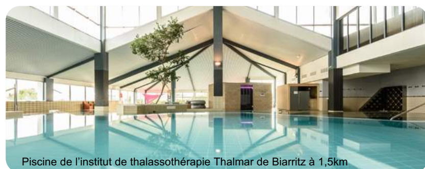
Piscine de l'institut de thalassothérapie Thalmar de Biarritz à 1,5km

Plus d'infos sur notre résidence, cliquez-ici!