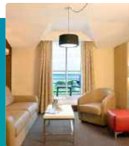
Appartement 3 pièces 6 personnes (55m 2 )