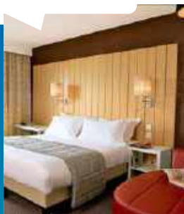
Appartement 2 pièces 4 personnes (40m 2 )