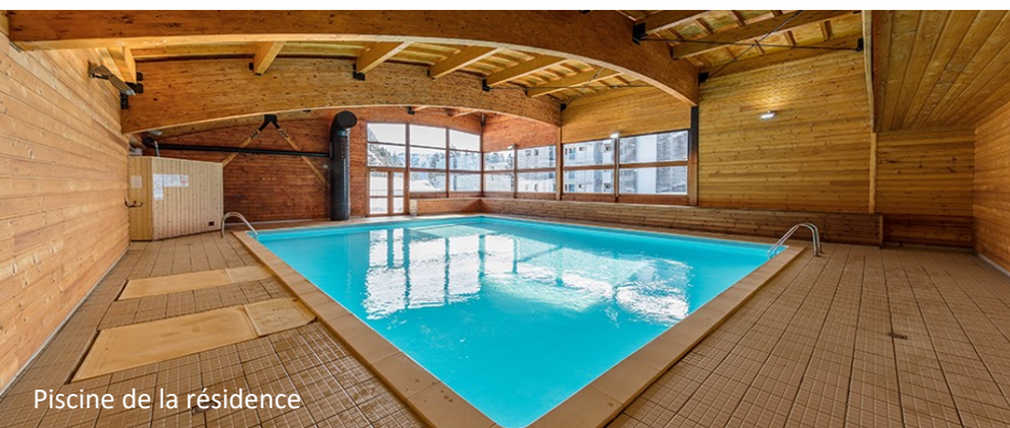
Piscine de la résidence

https://www.chamrousse.com/office-tourisme.html