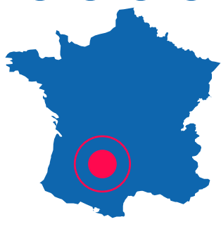
Entre Sarlat et Rocamadour