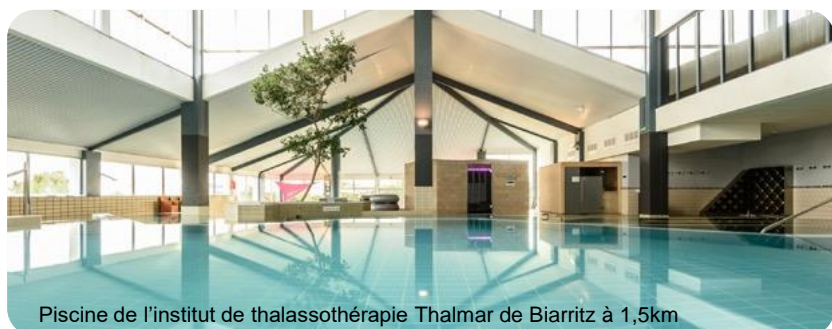
Piscine de l'institut de thalassothérapie Thalmar de Biarritz à 1,5km

Plus d'infos sur notre résidence, cliquez-ici!