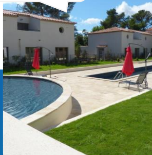
Villa Privilege (65m 2 ) climatisée