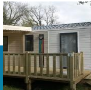
Mobil home Bermude 3 chambres 6 pers. (31m 2 )