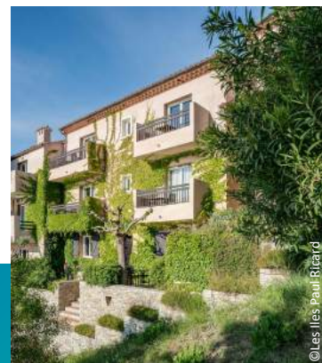
Appartement 6 personnes (environ 40m²) climatisé