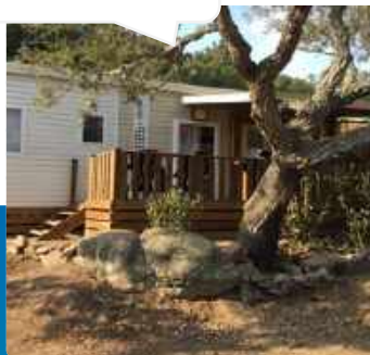
Mobil-home 3 chambres 6 pers. (31m 2 ) +terrasse, climatisé