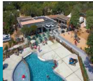
Piscine et restaurant