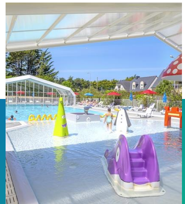
La piscine couverte et chauffée et l'aire de jeux aquatique enfants