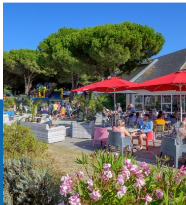
Le bar et sa terrasse

Cette destination, sports et nature, séduira petits et grands !