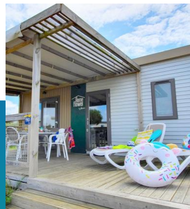
Homeflower Premium 2 chambres