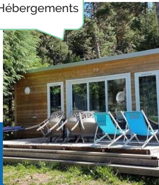
Cottage family 4 personnes