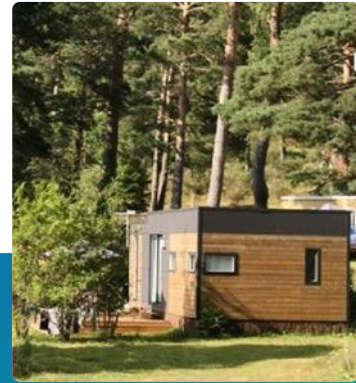
Cottage premium 6/8 pers.